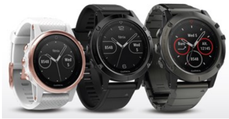
FENIX 5S | FENIX 5 | FENIX 5X